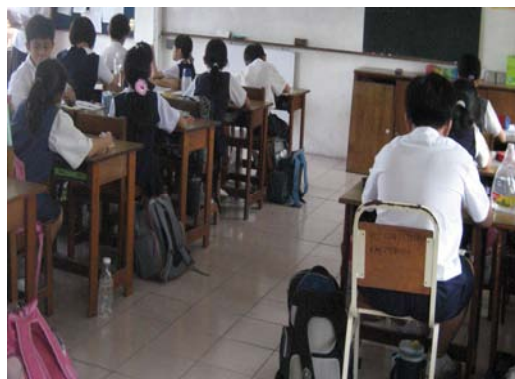
Murid menulis karangan