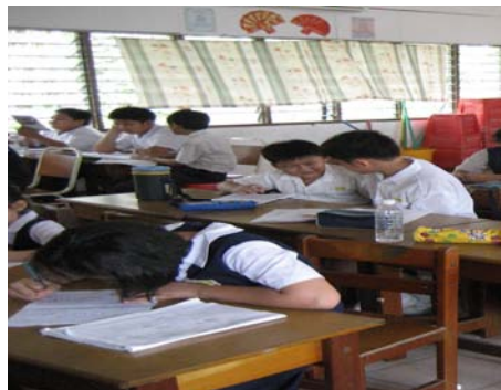
Guru memberi bimbingan dan murid berinteraksi dengan rakan