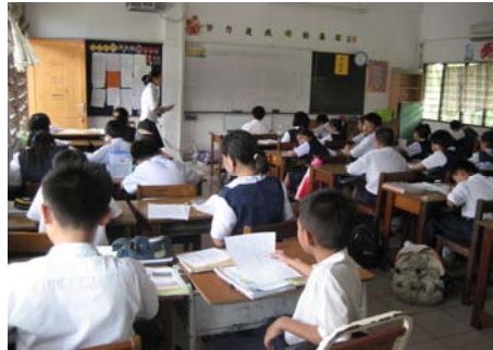
Guru memberi penerangan dan mengemukakan tajuk karangan